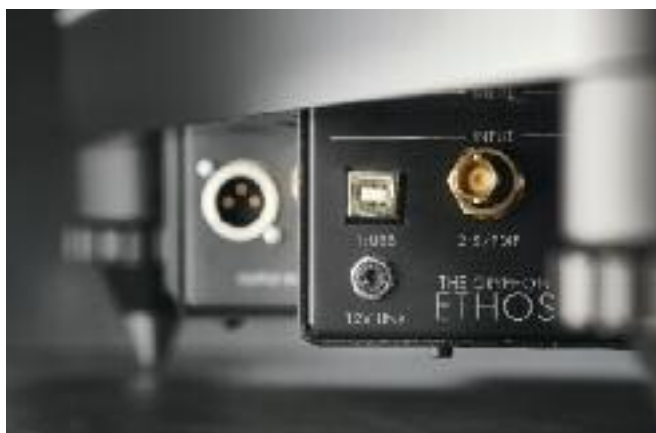
La presa USB in primo piano.

E quindi, per la proprietà transitiva, capisci anche che in Gryphon riescono a evitare aloni, ridondanze, distorsioni più degli altri. E riescono a farlo in tutte le diverse tipologie di elettroniche che progettano. Compreso Ethos, che, per l'appun-