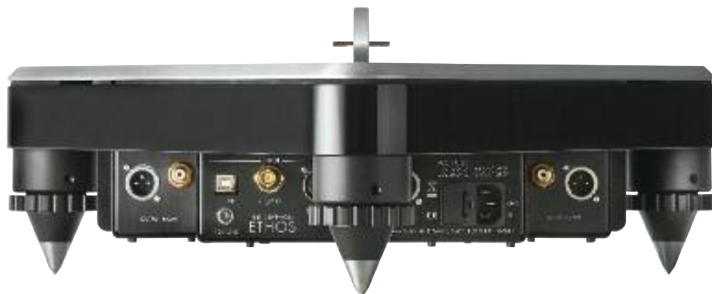
L'Ethos visto dal retro consente di apprezzare le notevoli possibilità di connessione.

Internamente troviamo la solita, spettacolare, olimpica puli-