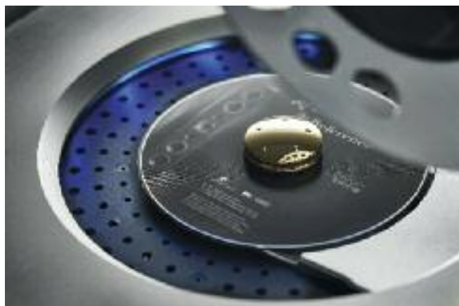
L'incavo della meccanica, il clamp è in metallo dorato.

Quantomeno trovo elegantissima, cosa che non a molti altri produttori riesce di fare, la fusione dell'argento del pannello superiore con il nero lucido dello chassis vero e proprio. Dotato di tre piedini Gryphon Atlas (colgo l'occasione per ricordare che per tre punti passa uno e un solo piano e nessun ingegnere capace ha ancora confutato l'assunto), con punte affilate regolabili in altezza con delle grandi ghiera dalla facile