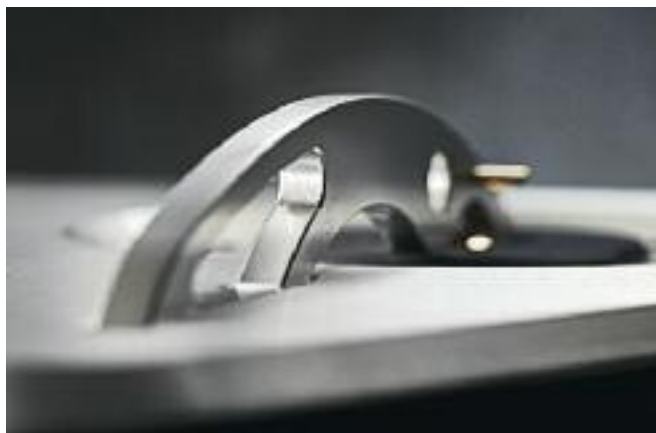
La maniglia con cui si apre, manualmente, il vano di lettura.

DAC2X. L'ambiente d'ascolto è magistralmente trattato da venti Daad e un Volcano disposti da Acustica Applicata, mentre la ciabatta di alimentazione è Faber's Cables.