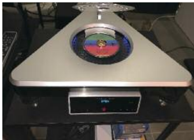
L'Ethos in sala d'ascolto.

Dico solo che, per assurdo, il lettore Gryphon Ethos risulta